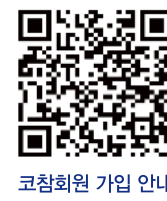
코참회원 가입 안내